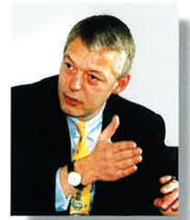
Dirk-Uwe Klaas, Hauptgeschäftsführer des Bundesverbandes Deutscher Fertigbau e.V. (BDF)