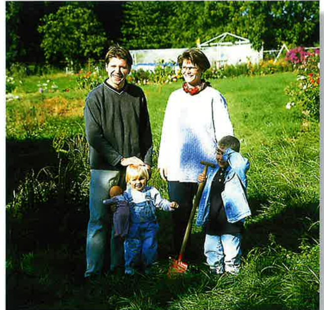
Bauherrschaft Behrens ist begeistert: Nur drei Monate dauert es von der grünen Wiese bis zum Einzug.

„Die schnelle Bauweise und die verbindliche Termintreue waren für uns die formalen Hauptkriterien fürs Fertighaus. Und weil die ganze Familie allergisch vorbelastet ist, konnte auch die inhaltliche Entscheidung nur lauten: ein durch und durch ökologisches, sprich wohngesundes Haus. Überzeugt hat uns beim gewählten Haus das schlüssige Gesamtkonzept von der unbehandelten Lärchenholz-Fassade bis hin zum wunderbaren Innenraumklima dank Naturmaterialien und Konstruktionsprinzip. Zu den ökologischen Vorteilen zählen wir auch den Niedrigenergie-Standard sowie die standardmäßige Vorbereitung für Regenwasser- und Solarnutzung. Das sind natürlich gleichzeitig auch ökonomische Aspekte, die in dem ganz sicher hohen Wiederverkaufswert dieses zukunftsweisenden Hauskonzeptes münden. So werden Ökologie und Ökonomie beim Hausbau ideal vereint.“